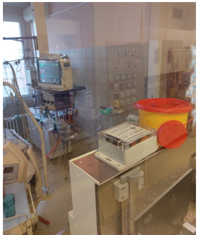
Obr. 7. Fotografie z in situ nasazení senzorů na JIP oddělení

Samotná implementace vyvinutého bezdrátového monitorovacího systému byla uskutečněna ve Fakultní nemocnici Ostrava. Bylo